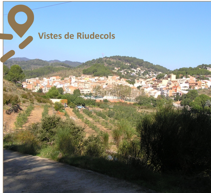
Vistes de Riudecols

L'avellana, el nostre fruit sec per excel·lència, es comercialitza actualment sota la Denominació d'Origen Avellana de Reus, localitat que actua com a centre de comercialització de bona part de la producció estatal d'avellana des de fa més de 5 segles. Pel seu contingut en minerals, proteïnes i greixos saludables, constitueix un dels fruits energètics més adients per l'aliment de l'excursionista. Esperem que les nostres avellanes us donin forces per descobrir i tastar aquest territori!