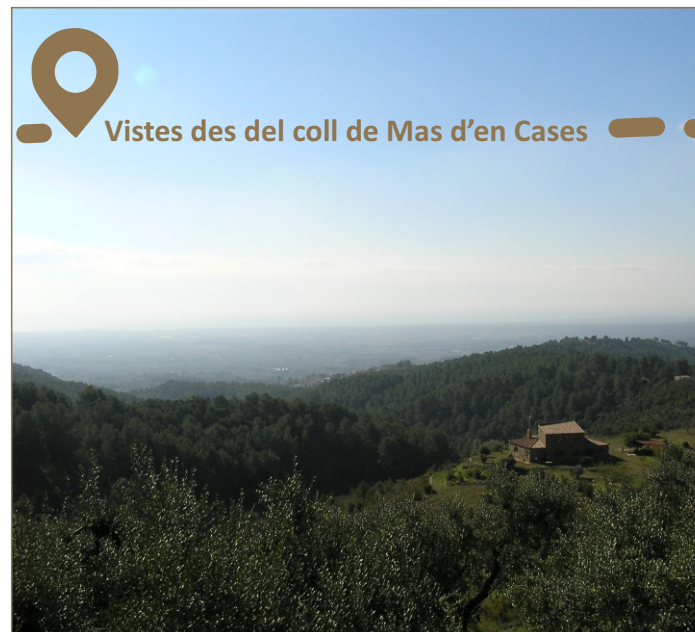
Vistes des del coll de Mas d'en Cases