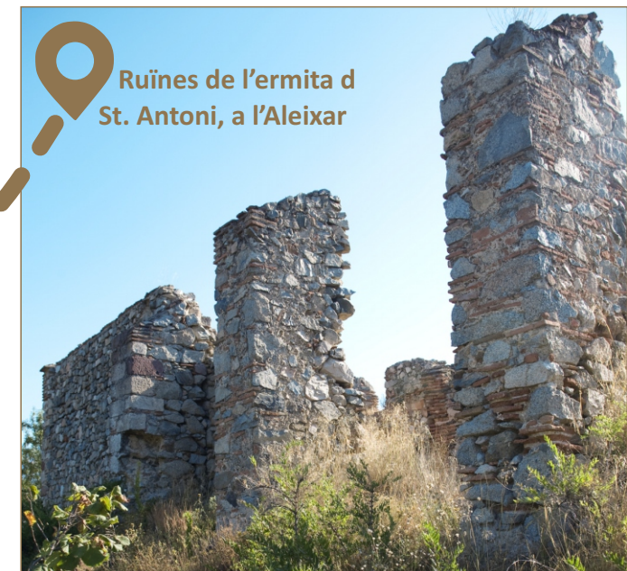
Ruïnes de l'ermita d St. Antoni, a l'Aleixar

Excursió pels camps de Maspujols, l'Aleixar i les Borges del Camp, que conviuen amb una urbanització dispersa i, sovint, amb fenòmens devastadors com els incendis forestals. La ruta travessa una zona afectada per un incendi que cremà als termes de les Borges del Camp, Maspujols, l'Aleixar i Alforja. Aquest recorregut ens permetrà reflexionar i veure els efectes de l'abandó dels antics conreus colonitzats de nou per boscos no gestionats que multipliquen el perill d'incendis.