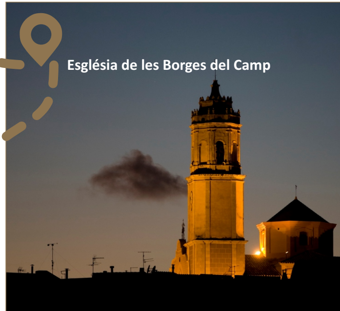
Església de les Borges del Camp

L'avellana, el nostre fruit sec per excel·lència, es comercialitza actualment sota la Denominació d'Origen Avellana de Reus, localitat que actua com a centre de comercialització de bona part de la producció estatal d'avellana des de fa més de 5 segles. Pel seu contingut en minerals, proteïnes i greixos saludables, constitueix un dels fruits energètics més adients per l'aliment de l'excursionista. Esperem que les nostres avellanes us donin forces per descobrir i tastar aquest territori!