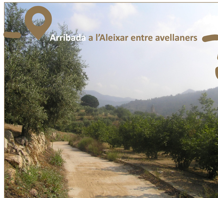
Arribada a l'Aleixar entre avellaners