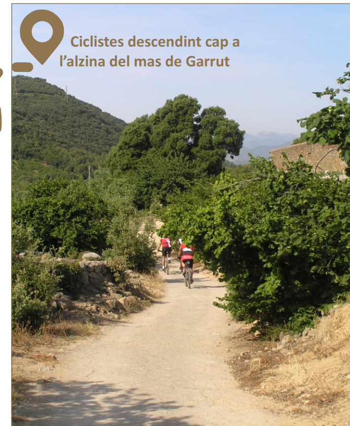
Ciclistes descendint cap a l'alzina del mas de Garrut

Excursió que ens permetrà gaudir dels camps conreats que s'enfilen als contraforts de les Muntanyes de Prades, un paisatge agrari escenari de les accions dels maquis, com l'intent de sabotatge de la línia elèctrica de Seròs a Reus per commemorar la proclamació de la II República (1947). En van volar una torre elèctrica al terme de Vilaplana, però sembla que no n'aconseguien interrompre el funcionament.