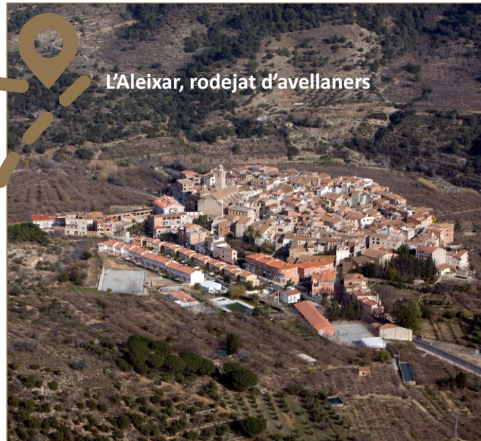
L'Aleixar, rodejat d'avellaners

L'avellana, el nostre fruit sec per excel·lència, es comercialitza actualment sota la Denominació d'Origen Avellana de Reus, localitat que actua com a centre de comercialització de bona part de la producció estatal d'avellana des de fa més de 5 segles. Pel seu contingut en minerals, proteïnes i greixos saludables, constitueix un dels fruits energètics més adients per l'aliment de l'excursionista. Esperem que les nostres avellanes us donin forces per descobrir i tastar aquest territori!