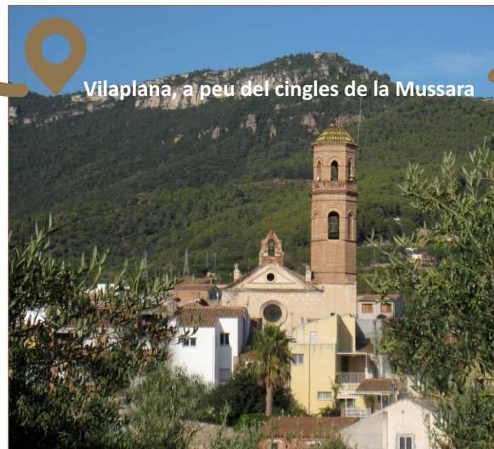
Vilaplana, a peu del cingles de la Mussara