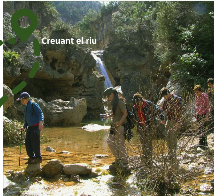
Creuant el riu

Tot un bosc de sensacions que ens permetrà gaudir d'aquestes Muntanyes amb els cinc sentits!